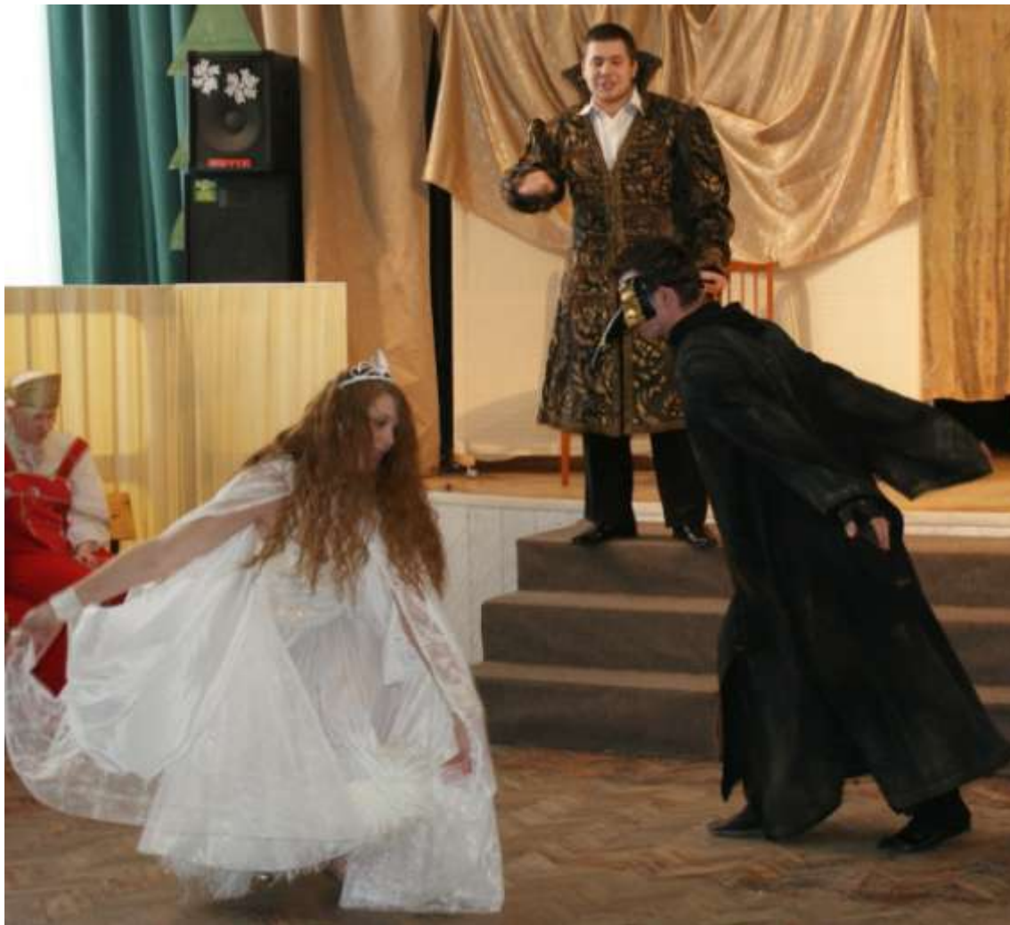
Сцена из спектакля «Сказка о царе Салтане»

Формирование творчески активной личности ребенка с ОВЗ, способной к самовыражению, посредством театрального осмысления поэтического наследия человечества. Повышение общей культуры воспитанников.