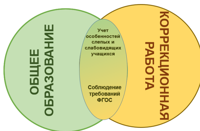
Рис. 4. Целостность комплекса общего и коррекционного образования

вторых, - в соблюдении организационно-технологических и содержательных требований федерального государственного стандарта основного общего образования (ФГОС ООО).