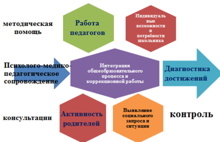
Рис. 5. Модель коррекционной работы школы-интерната